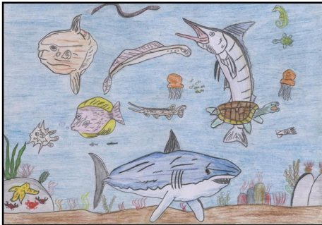
Balohg Imre 8.a